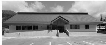
写真2 東北森林管理局会津森林管理署南会津支署

環境対策項目③「木材利用の推進」では、実施事例として東北森林管理局会津森林管理署南会津支署(写真2)及び中国四国管区警察学校(渡り廊下部分)の木造化と函館海上保安部瀬棚海上保安署及び中部森林管理局森林技術・支援センターにおける内装の木質化を紹介しています。