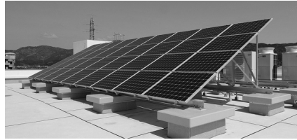
写真1 延岡労働総合庁舎の太陽光発電設備

環境対策項目②「太陽光等の再生可能エネルギー利用の推進」では、実施事例として延岡労働総合庁舎の太陽光発電設備(写真1)を紹介しています。